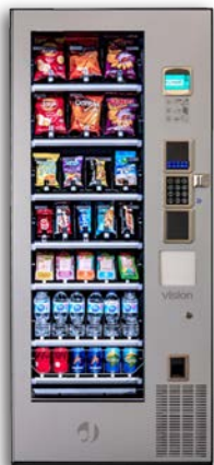
VISION COMBOPLUS V8

8 bandejas de hasta 7 canales Grupo frío opcional Con ascensor