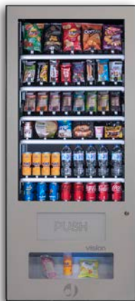
VISION ESPLUS V8

8 bandejas de hasta 7 canales Grupo frío opcional Con ascensor