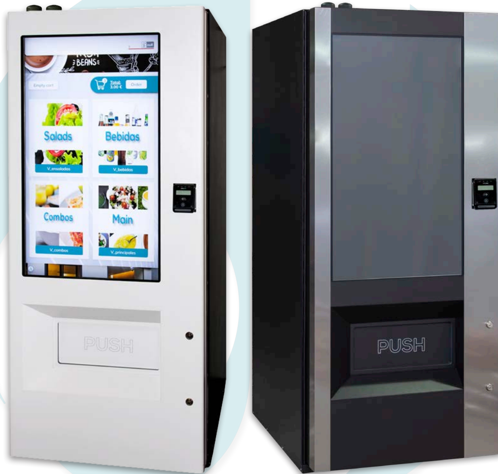
ESPlus Touch V8 Experiencia de compra

El gran distintivo de la ESPlus Touch V8 es su display; una gran pantalla táctil de 43" que facilita la experiencia de compra del usuario por hacerla más intuitiva.