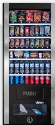
VISION ESPLUS BLUETEC V8