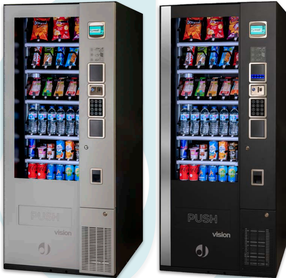
EasyCombo V8 Control total

La Vision EasyCombo V8 de Jofemar permite la conexión de hasta 3 módulos satélite, ampliando notablemente la capacidad de productos.