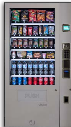
VISION ESPLUS V8 + UNIDAD DE CONTROL

6 bandejas de hasta 10 canales y 2 de hasta 7 can. Grupo frío opcional Sin ascensor