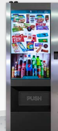
VISION ESPLUS TOUCH BLUETEC V8