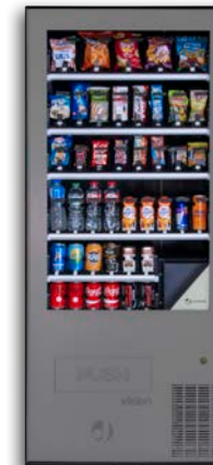
VISION SATELLITE V8

8 bandejas de hasta 10 canales Grupo frío opcional Con ascensor