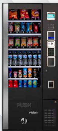
VISION EASYCOMBO BLUETEC V8