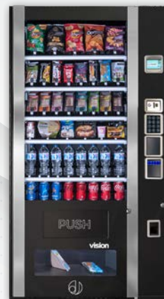
VISION ESPLUS BLUETEC V8 + UNIDAD DE CONTROL