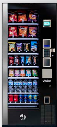
VISION COMBOPLUS BLUETEC V8