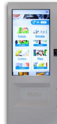
VISION ESPLUS TOUCH V8

6 bandejas de hasta 10 canales y 2 de hasta 7 can. Grupo frío opcional Sin ascensor