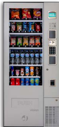
VISION EASYCOMBO V8

8 bandejas de hasta 10 canales Grupo frío opcional Con ascensor